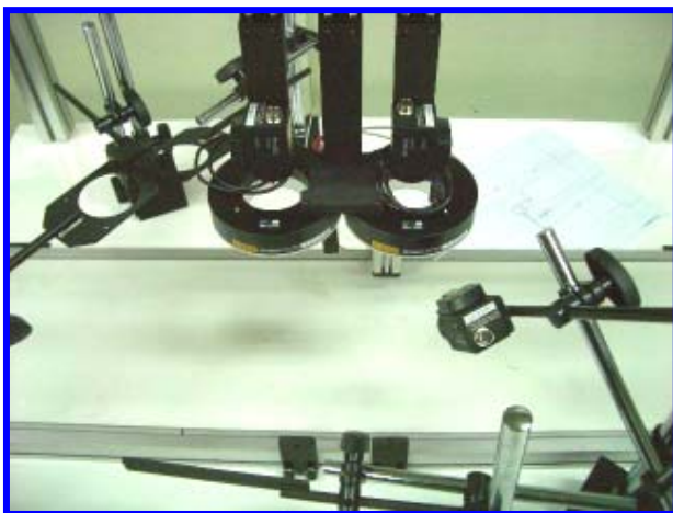
Model : KVS-001RY